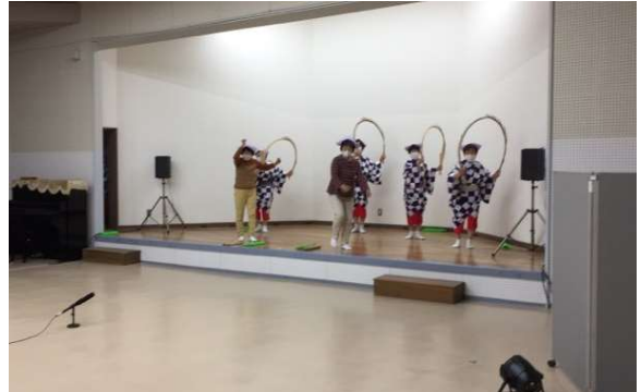
ライブ配信の様子